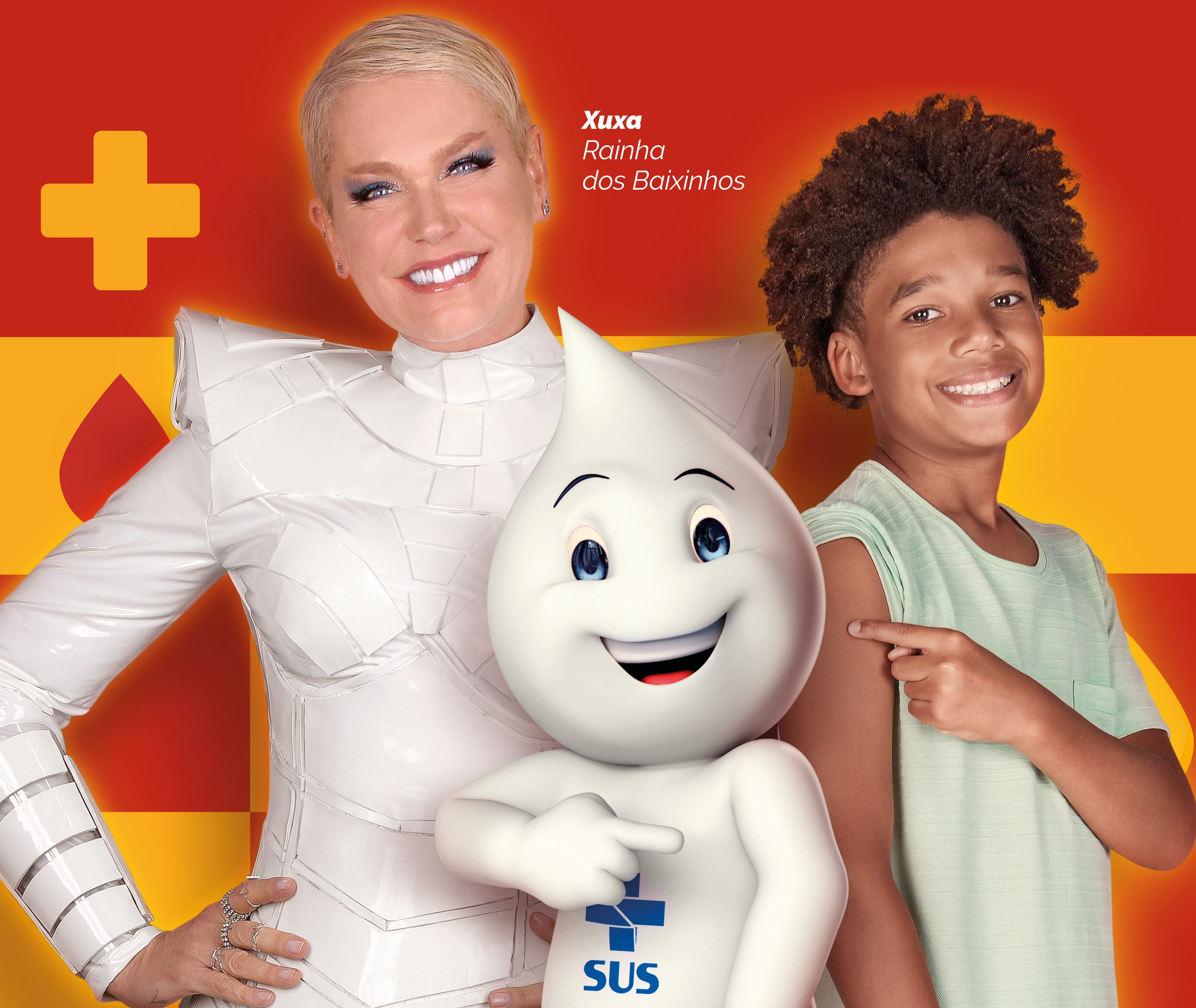
Xuxa Rainha dos Baixinhos

ATUALIZE A CADERNETA DE VACINAÇÃO DE CRIANÇAS E ADOLESCENTES MENORES DE 15 ANOS.